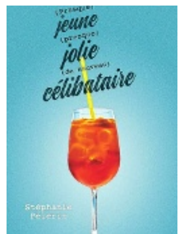
Son premier roman.