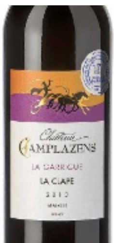
Médaille d'argent 2015.

La Garrigue - AOC La Clape - Château Camplazens. Prix départ cave : 10 €. Tél. 04.68.45.38.89. www.camplazens.com