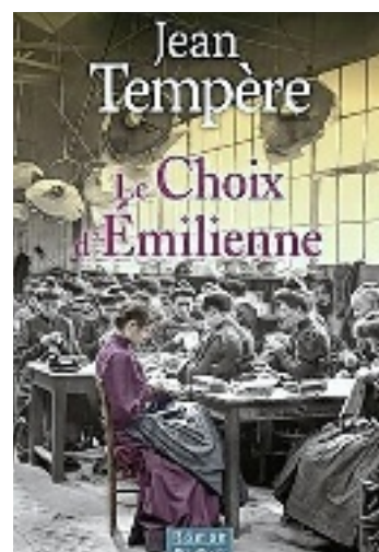
Un amour contrarié.

Ouvrière dans une usine de coiffes à chapeaux, Emilienne vient à la rencontre de Firmin, chasseur de vipères, pour une morsure. Mieux que le reptile, c'est bientôt l'amour qui va piquer les deux jeunes gens. Mais Milou, le frère de la jeune femme, petit proxénète autoritaire et sans scrupule, lui préfère un autre prétendant, Fabrice, le contremaître de l'usine. Emilienne a le cœur à la dérive et lorsqu'elle fait son choix, un meurtre fait basculer sa vie.