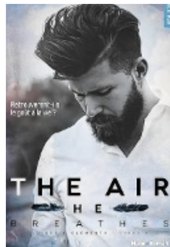
La romance de l'été.

Elizabeth et Tristan sont voisins et ils n'ont a priori qu'un point commun : ils ont tous les deux perdu les personnes les plus chères à leurs yeux dans un accident de voiture. Elizabeth a perdu son mari, Steven, et doit trouver la force de continuer à vivre pour leur fille Emma. Tristan doit retrouver un sens à sa vie sans Jamie et Charlie, sa femme et son fils. Une histoire de deuil, d'amour et d'espoir.